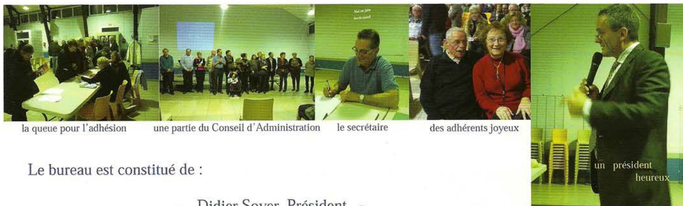
la queue pour l'adhésion

L'assemblée générale s'est terminée autour d'un buffet campagnard citoyen.