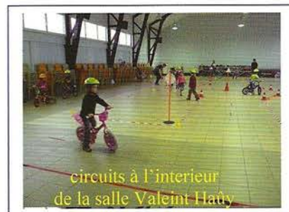
circuits à l'intérieur de la salle Valentin Haüy