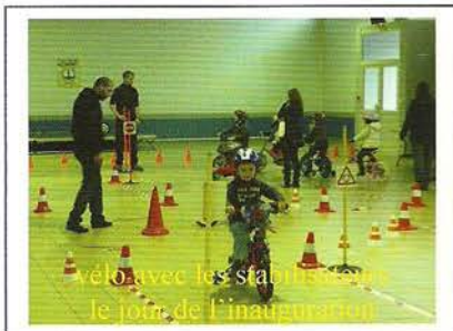
vélo avec les stabilisateurs le jour de l'inauguration

Le projet estimé à 11 360 € est financé à 40% par les services de l'État, 20% par d'autres partenaires (Vélo service DSP de la ville d'Amiens) et 45% par le comité de quartier.