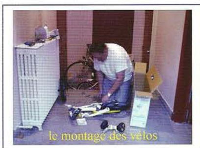
le montage des vélos

Il a été acquis 41 vélos et 41 casques pour les trois écoles maternelles pour le bon déroulement de cette action.