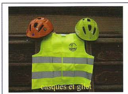
casques et gilet

La ville d'Amiens a pris en charge le tracé de 6 circuits routiers dans les cours des écoles et a mis à disposition la salle Valentin Haüy pour les différents besoins de l'action.