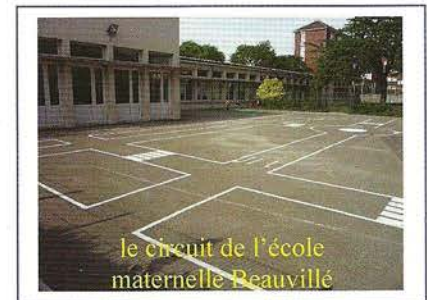
le circuit de l'école maternelle Beauvillé