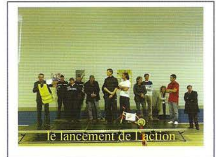
le lancement de l'action